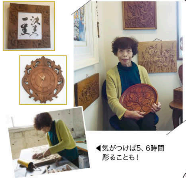
◀気がつけば5、6時間彫ることも!