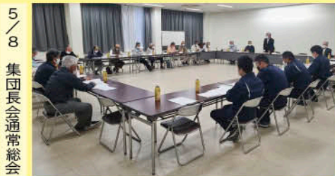
5/8 集団長会通常総会

地域農業の維持・発展や生産者の所得向上に向け、各組織が連携して課題の解決に取り組んでまいります。