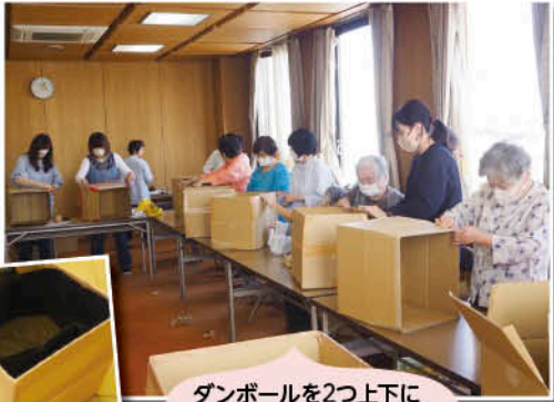
ダンボールを2つ上下に組み合わせるだけで簡単!