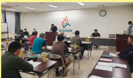
5/11 農振協青年部通常総会