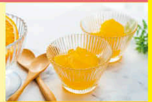
柑橘紅まどんな。入りゼリー&せとかのゼリー (JAえひめ中央)