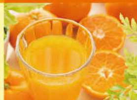
清美・しらぬひジュース (JAにしうわ)