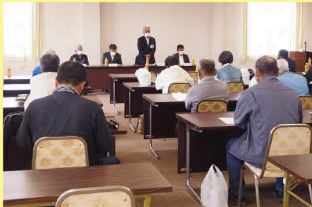
丹原地区の地区別総代研修会の様子

J A 周桑では、毎年6月に行われる通常総代会を前に、各支所で地区別総代研修会を開き、昨年度の事業報告や、総代会に向けた意見交換を行いました。また、自己改革工程表の進捗状況や今年度の事業方針などの説明が行われ、今年度より本格的に始まる本・支所再編や、資材価格高騰に関する取り組みなど、様々な意見や要望が出されました。J Aでは、今後も組合員の皆様の意見を反映し、地域に必要とされるJ Aであり続けるよう取り組んでまいります。