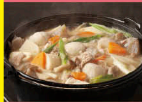
「伊予美人」芋炊きセット (JAうま)