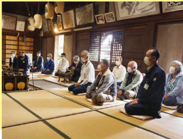
冥福を祈る出席者

5月19日、畜産部会は丹原町の久妙寺で家畜の霊を弔う畜魂祭を行いました。過去1年間に出荷された牛への感謝と、畜産農家繁栄への願いを込めて毎年開いています。畜産部会やJA関係者が出席し、家畜の尊い命に感謝するとともに、冥福を祈りました。