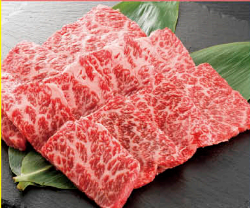
伊予牛「絹の味」黒毛和牛肩ロース鉄板焼き用(全農えひめ)