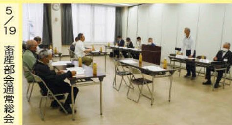
5/19 畜産部会通常総会