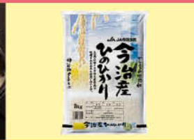
今治産ひのひかり (JA今治立花)