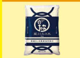
蔵川エコ米「てんたかく」(JA愛媛たいぎ)