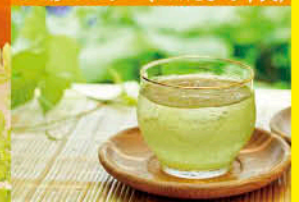
宇和茶セット (JAひがしうわ)