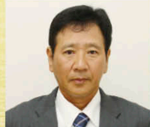
やの だい 矢野 大 全区域 (壬生川)