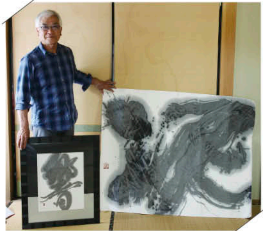
▲昨年東京都で開催された独立書展で優秀作品に選ばれた書(右)。「泥」をイメージした作品。今年6月には、独立選抜書展に出品されました。