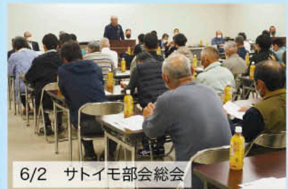
6/2 サトイモ部会総会