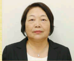
いい お 飯尾 さつき 全域 (女性)