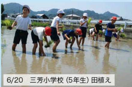
6/20 三芳小学校(5年生) 田植え