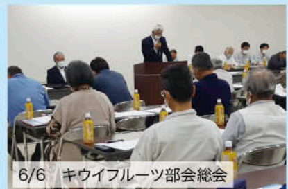
6/6 キウイフルーツ部会総会