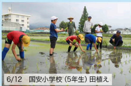
6/12 国安小学校(5年生) 田植え