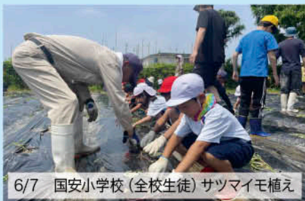
6/7 国安小学校(全校生徒) サツマイモ植え