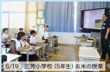
6/19 三芳小学校(5年生) お米の授業