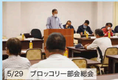
5/29 ブロッコリー部会総会

各組織の通常総会が開催されています。コロナ禍以前同様に多くの部会員が参加し、令和5年度の活動計画や生産・販売方針などについて協議しました。令和5年度は、高品質で安全・安心な周桑産農産物の生産、提供に努め、販売面では市場や関係機関と連携し消費宣伝、販売促進活動で有利販売につなげます。