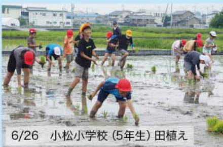
6/26 小松小学校(5年生) 田植え