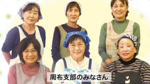
周布支部のみなさん