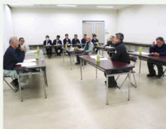
▲総会での話し合いの様子