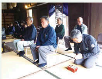
▲畜魂祭で冥福を祈る部会員

その後、営農管理研修センターで総会が開催され、令和7年度の活動報告や令和8年度の活動計画並びに収支予算が承認されました。令和8年度は防疫・衛生管理を徹底し、コスト低減による安定経営を目指し、安全・安心で高品質な畜産物の生産に努めてまいります。