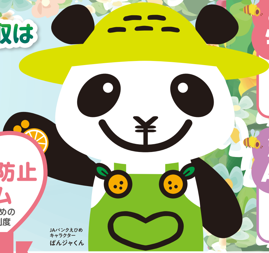
JAバンクえひめ キャラクター ばんじゃくん