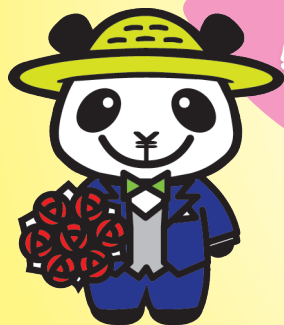
JAバンクえひめキャラクター ばんじゃくん