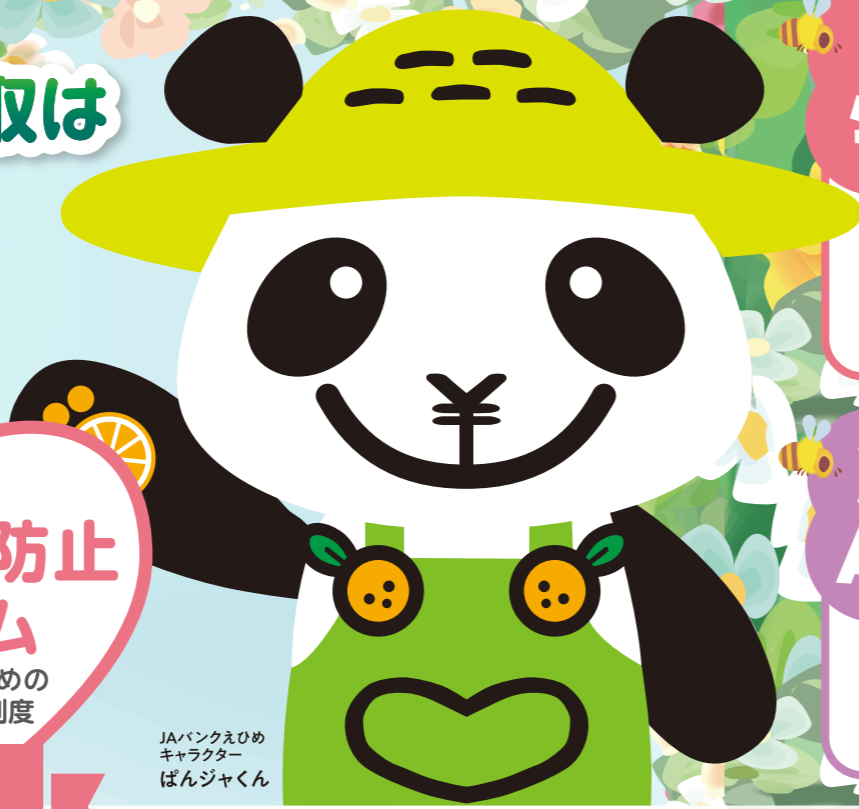
JAバンクえひめ キャラクター ばんじゃくん