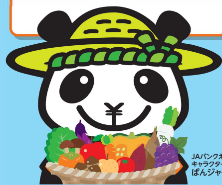
JAバンクえひめキャラクター ばんじゃくん